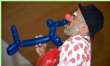
So. (14:00 und 15:30 Uhr): Giovannis Mitmachzirkus